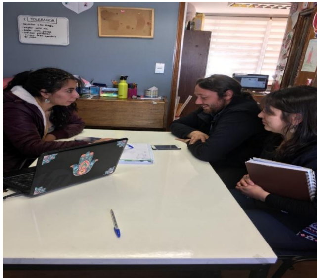
EQUIPO PIE 2019