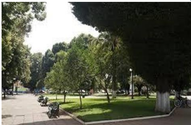
Figura N° 1 Plaza de Longaví