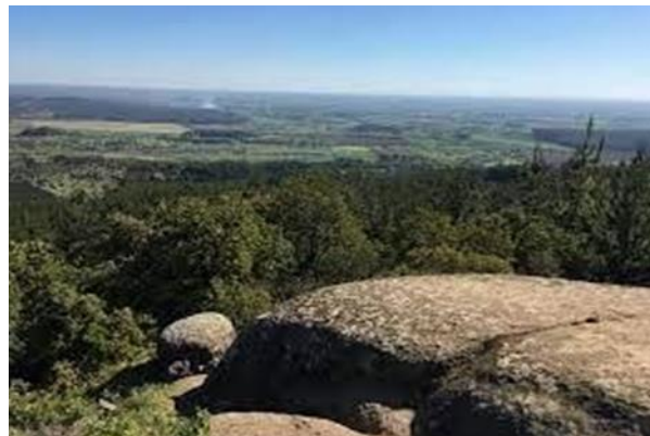
N° 2 Piedra del Batro.

La Comuna se presenta como parte de un sistema intercomunal de servicios y centralidades para las actividades agrícolas de la provincia. A escala local, la comuna está constituida por una red de poblados dedicados preferentemente a la actividad agro frutícola, que tiene un rol tanto de subsistencia como de abastecimiento a circuitos económicos mayores que la han ido posesionando dentro de una transformación a mercados más intensivos.