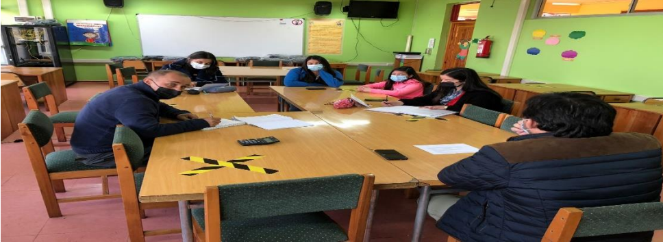
Foto Consejo Escolar Escuela La Loma 13 de agosto de 2021.