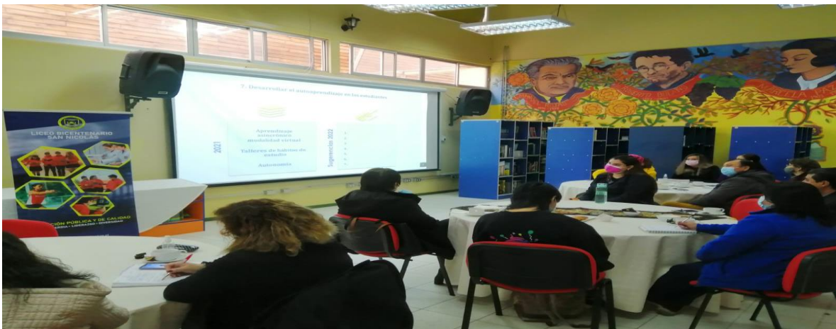
Foto Consejo Escolar Liceo Bicentenario de Excelencia Polivalente de San Nicolás 18 de agosto de 2021.