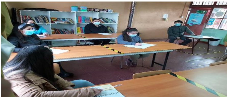
Foto de Consejo Escolar Escuela Dadinco 26 de agosto de 2021

En los últimos años la escuela no se ha visto beneficiada con reposiciones o mejoramiento significativo en su infraestructura, la cual se encuentra muy deteriorada.