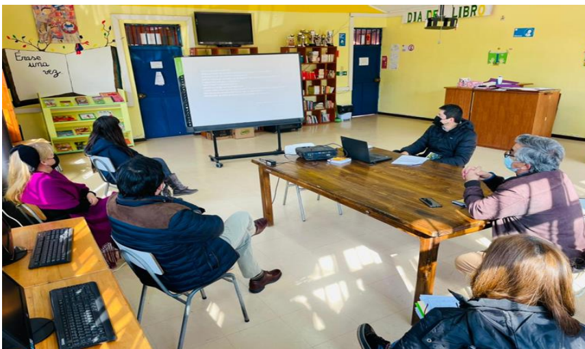
Foto Consejo Escolar Escuela Monteleón 11 de agosto de 2021.