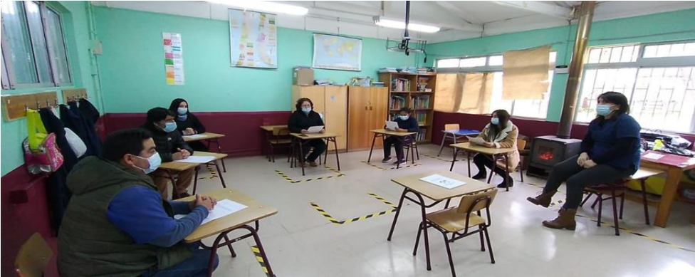
Foto Consejo Escolar Escuela Puente El Ala 19 de agosto de 2021