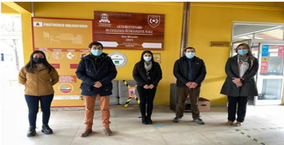
Foto Consejo Escolar Liceo Bicentenario de Excelencia Técnico Puente Ñuble 13 de agosto de 2021.

Estas plataformas, en particular las que son trabajadas en los cursos de prebásica y primer ciclo básico están consideradas como un fomento a la lectura, así como la comprensión de textos por parte de nuestros niños/as y jóvenes.