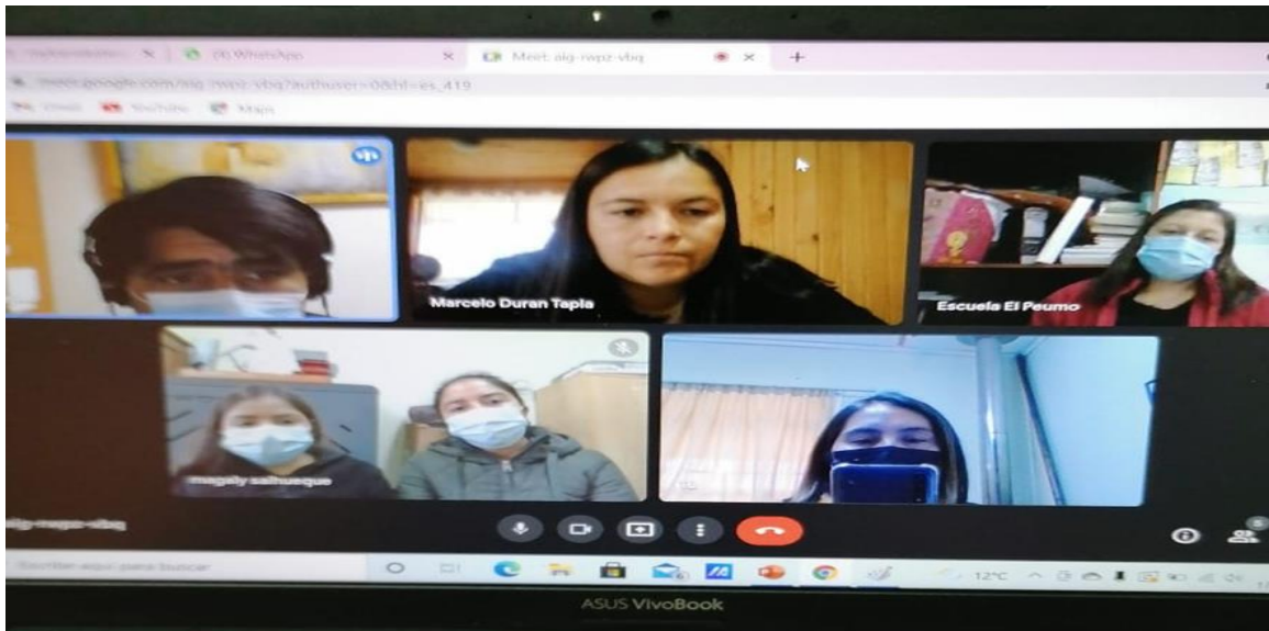
Foto Consejo Escolar Escuela El Peumo 17 de agosto de 2021

esto, que se decide que sería de gran ayuda capacitar a todo el establecimiento en el uso de ellas para seguir avanzando hacia un mejor aprendizaje generado desde el alumno.