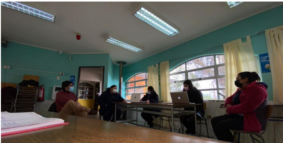
Foto Consejo Escolar Escuela Lajuelas 25 de agosto de 2021.